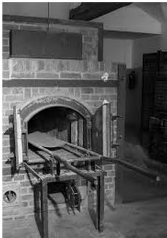
Похожую печь использовали в крематории Клинкерного завода

90 градусов, а носилки достаточно резко выбросило на полтора метра. В силу возраста я тогда не понимал, что передо мной печь крематория, в которой сжигали советских граждан.