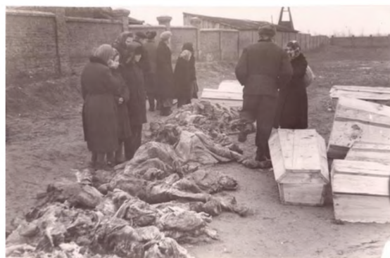
Останки погибших граждан обнаружили 19 ноября 1958 года в районе Лещинца.

общее число погибших евреев Гомеля равняется или даже превышает цифру 10 тысяч человек.