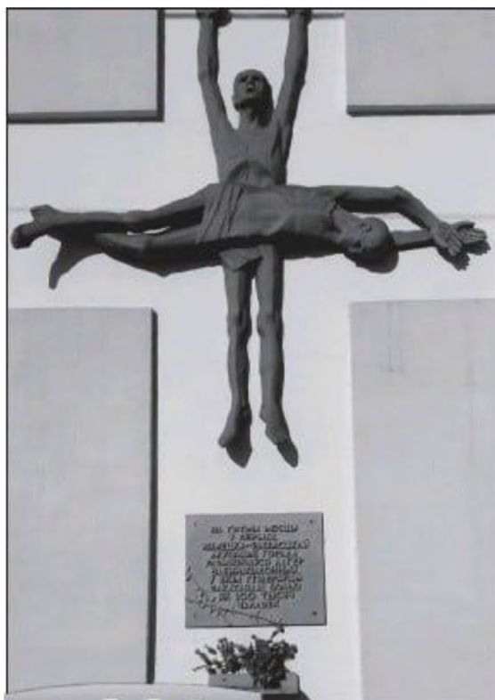
Мемориальная доска на площади Восстания в Гомеле

За годы Великой Отечественной войны в плену у фашистов находились 5 734 528 бойцов и командиров Красной армии.