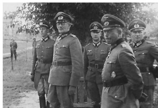
Немецкие офицеры ждали приезда генерал-фельдмаршала Вальтера фон Браухича, который прибыл в оккупированный Гомель для оценки ситуации 8 сентября 1941 года.

еврейского населения. Маленьких детей бросали в ямы прямо живыми и закапывали. Место расстрела гомельчан было в небольшом лесу около деревни Давыдовка, а также в 3-4 километрах от Гомеля по шоссе на Речицу. Здесь людей хоронили в 250-300 метрах справа от дороги. Эти ямы с расстрелянными я хорошо знаю, так как мне приходилось ходить этой дорогой и видеть свежие насыпи земли. Трупы зарывали совсем неглубоко, в связи с чем весной и летом 1943 года был большой запах.